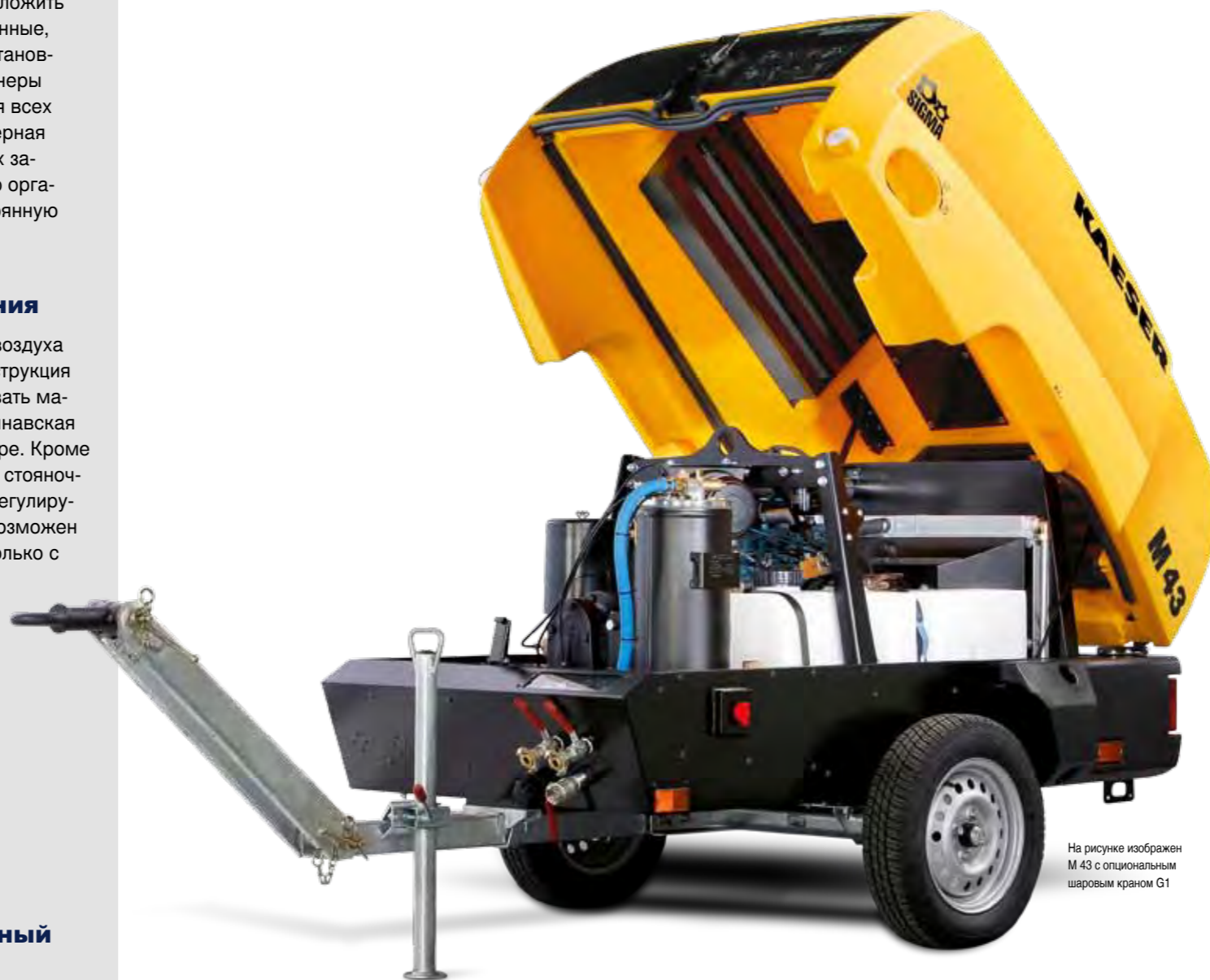
На рисунке изображен M 43 с опциональным шаровым краном G1